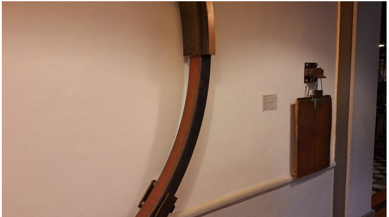
— Kupferschiene die zu Draht verarbeitet wird