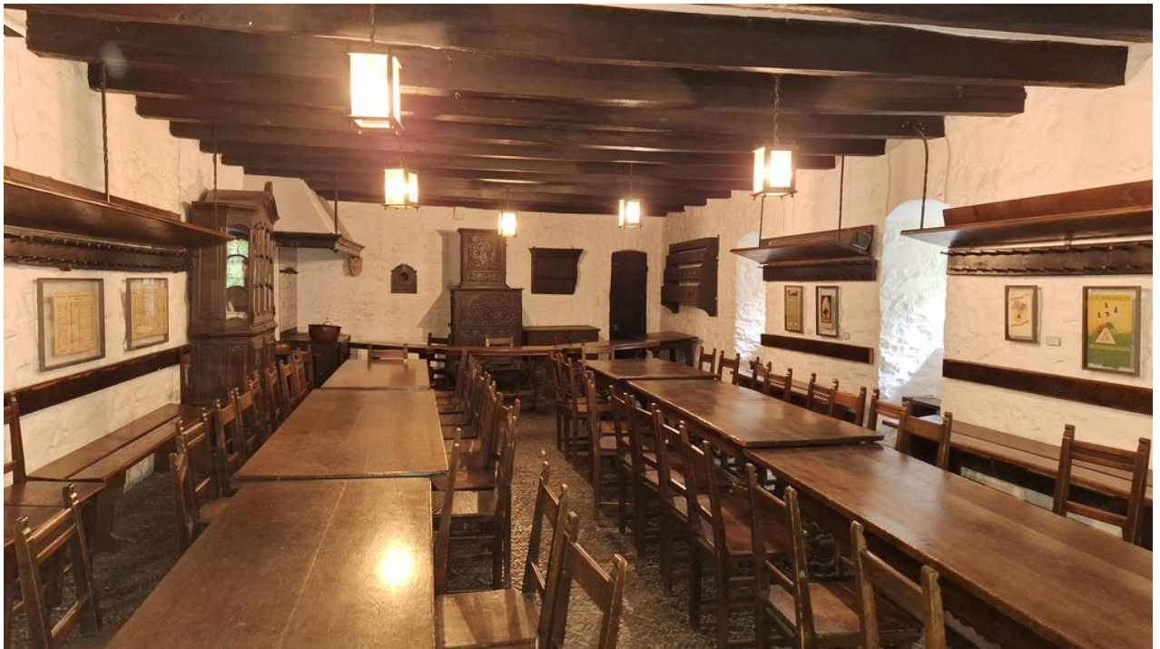
• Burg Altena: die älteste Jugendherberge der Welt (hier: Speiseraum)