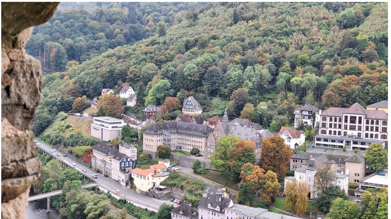
— Blick von der Burg Altena runter zur Stadt