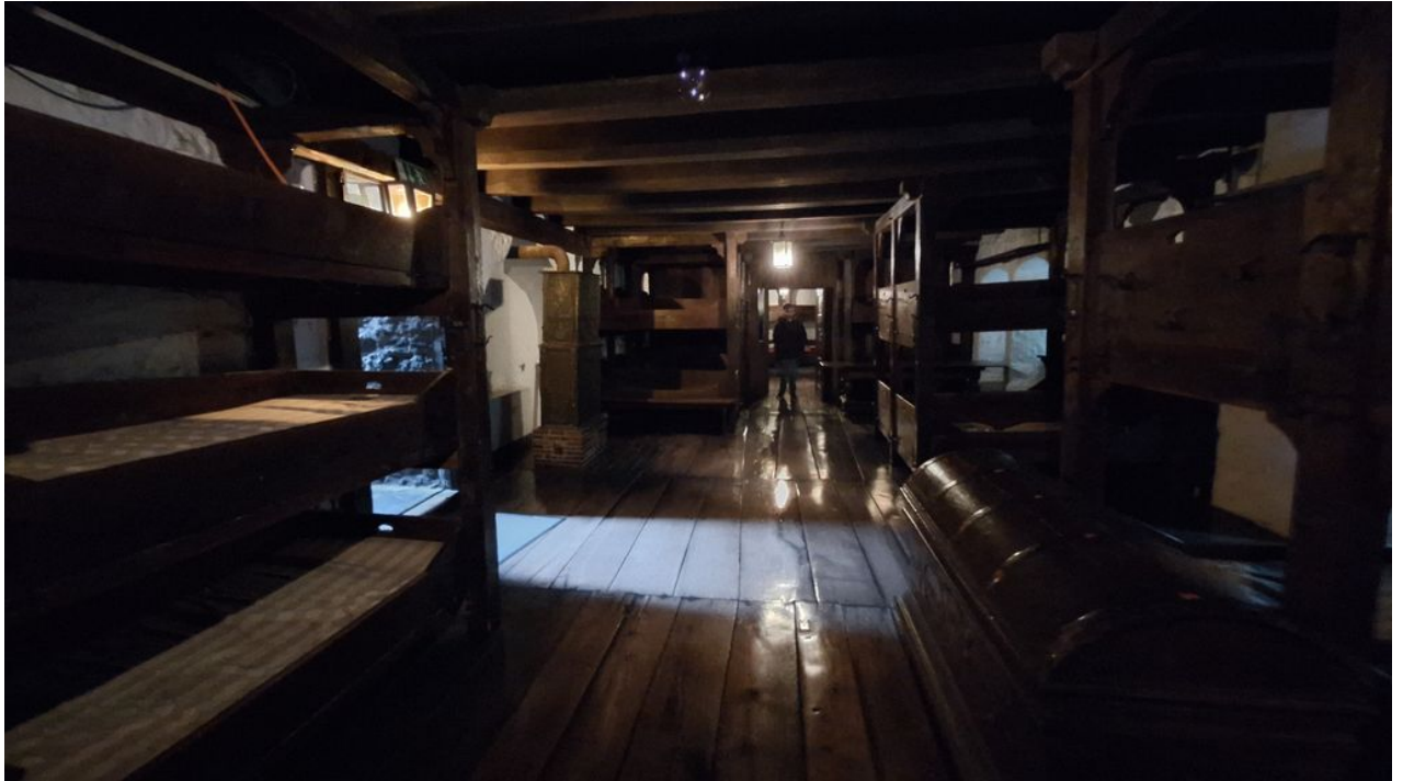
— älteste Jugendherberge der Welt: der Schlafsaal der Jungen, dahinter der Schlafsaal der Mädchen