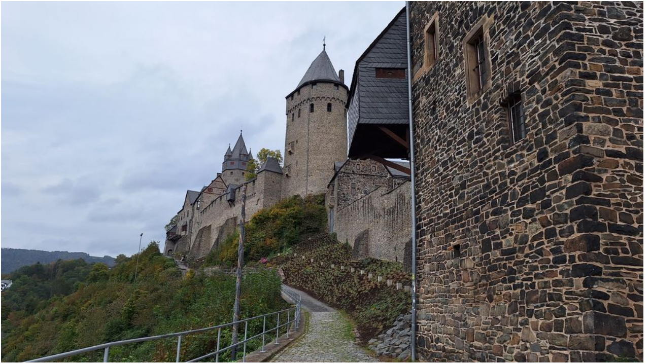
— Weg an der Burg vorbei