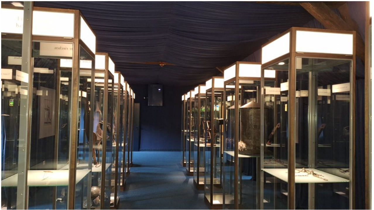
• immer wieder schön: Sprüche aus dem Mittelalter bildlich dargestellt