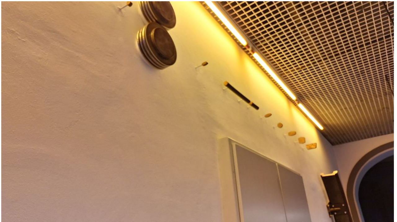
• _ beim ersten Mal übersehen: Ausstellungstücke unter der Decke