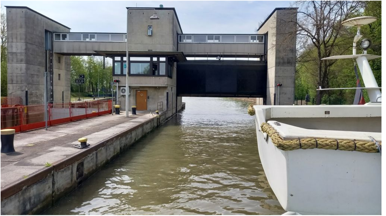
— Die 1. Schleuse