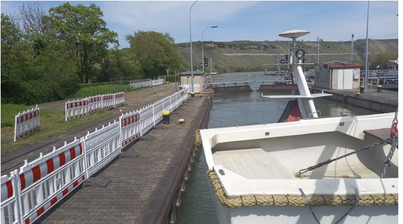
Die 2. Schleuse