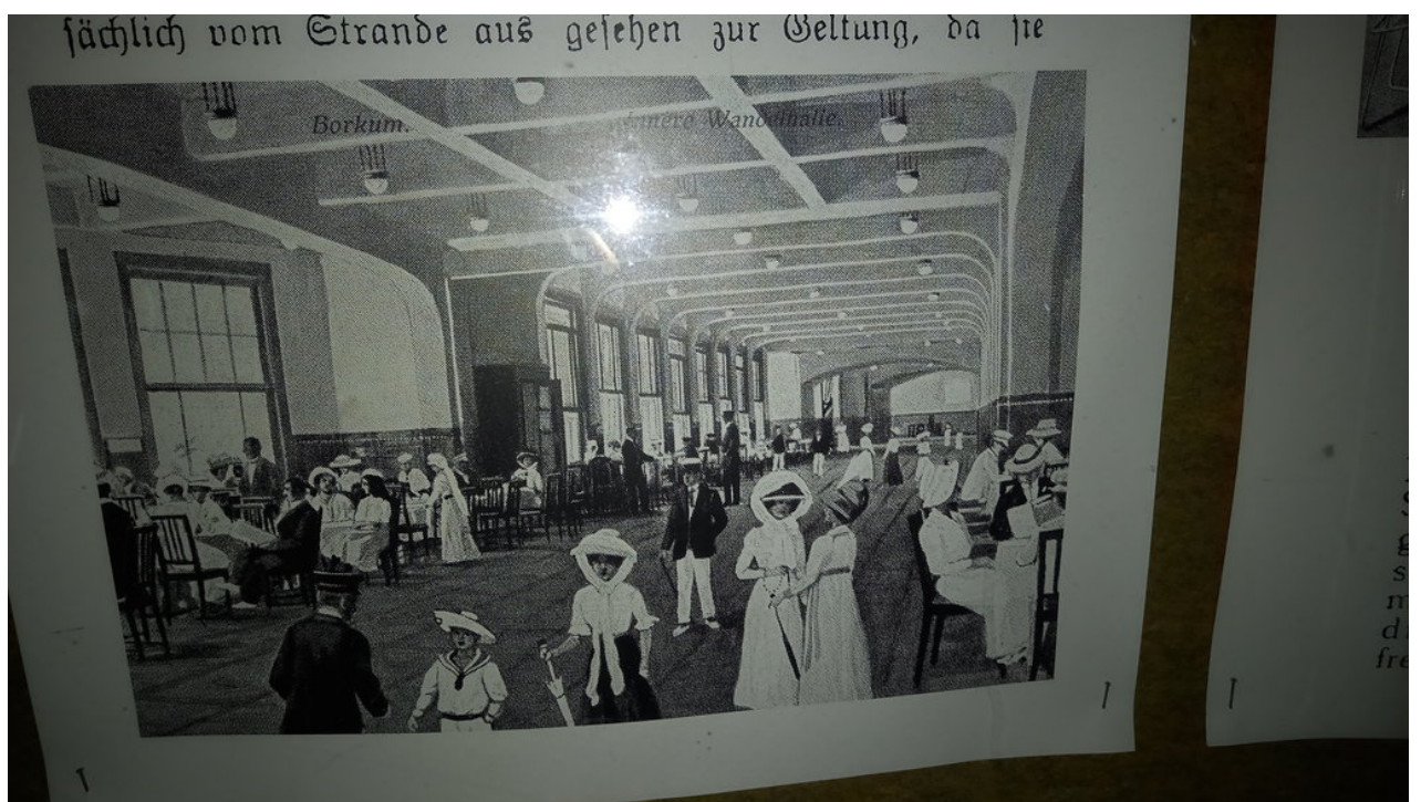
— So sah die Wandelhalle damals aus