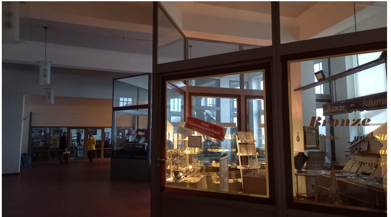
— Und so sieht sie heute aus