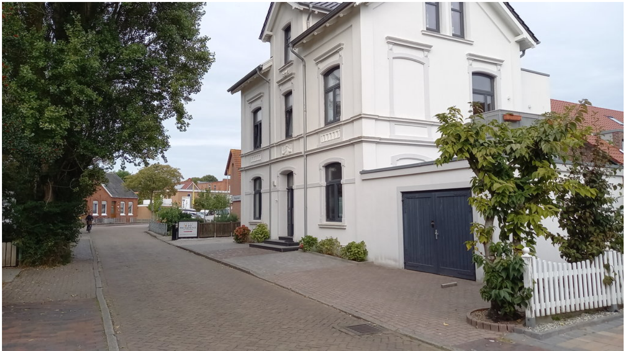
• Ein bisschen Borkum-Flair: irgendwo auf dem Weg zum Bäcker