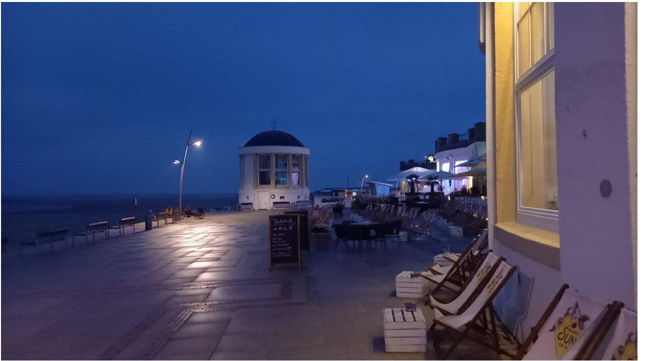
— Zurück zur Unterkunft