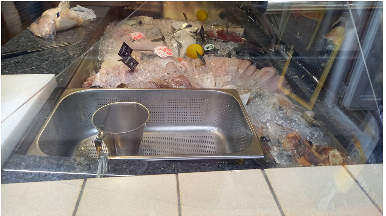
• Das erste Fischgeschäft direkt nach der Fähre