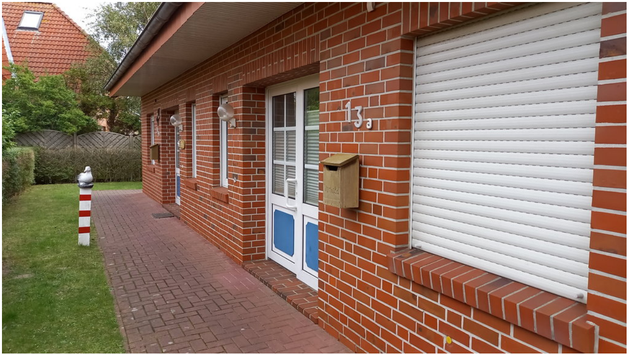
• Die Unterkunft