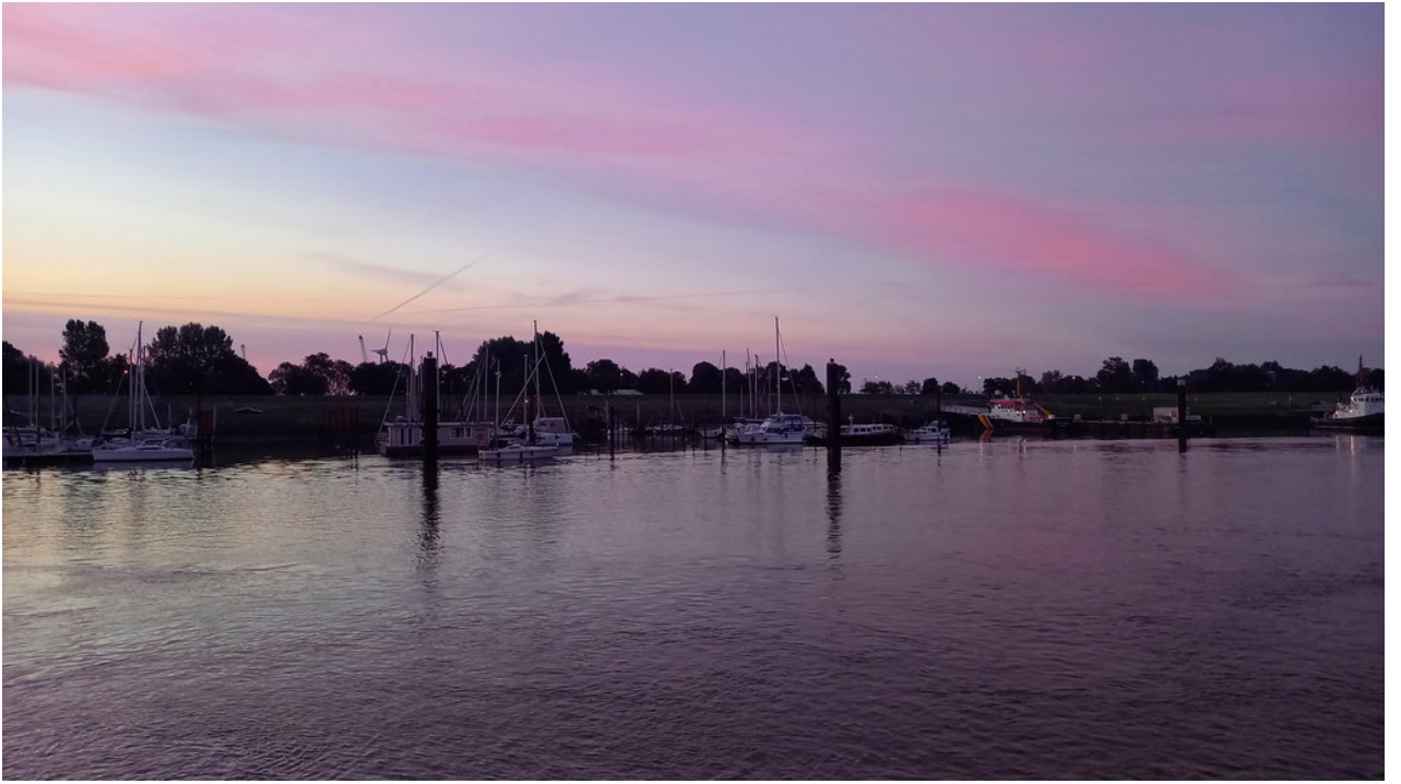
• Borkumer Hafen in Ems im Morgenlicht