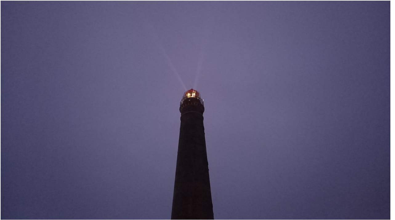
— Der Leuchtturm leuchtet - aber nur noch für die Touristen