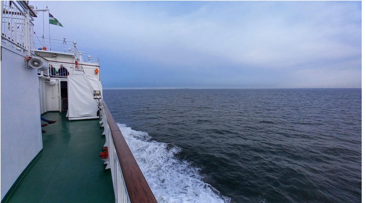
• Auf der Fähre Richtung Borkum