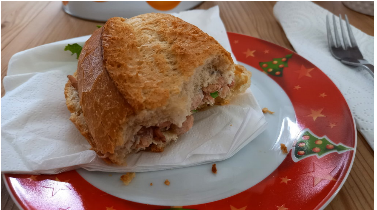
• Und direkt in der Unterkunft das erste Fisch - bzw Krabbenbrötchen