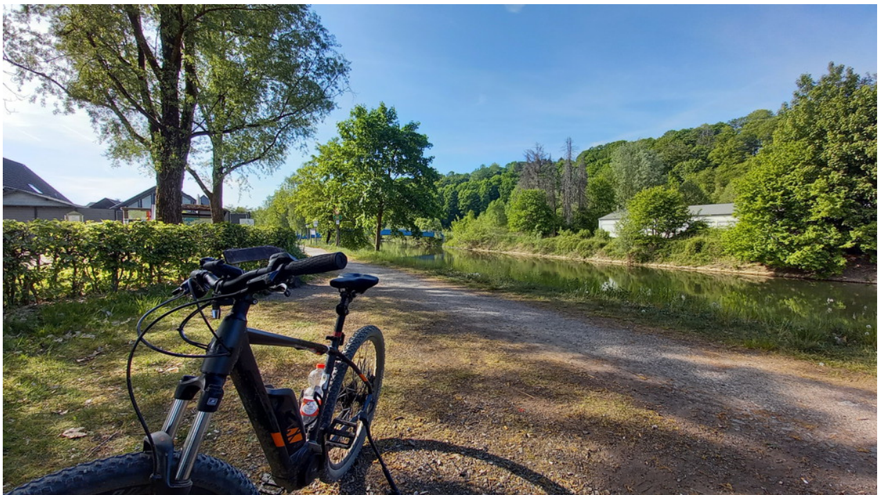
• 2. Trinkpause an "der blauen Brücke"