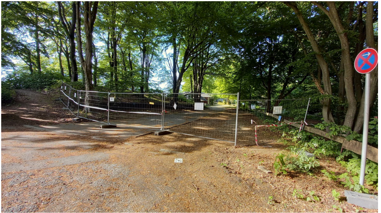
• Haus Hammerstein - leider schon seit 2020 geschlossen, da der Verein "Lebenshilfe" die Kosten für den Brandschutz nicht aufbringen kann