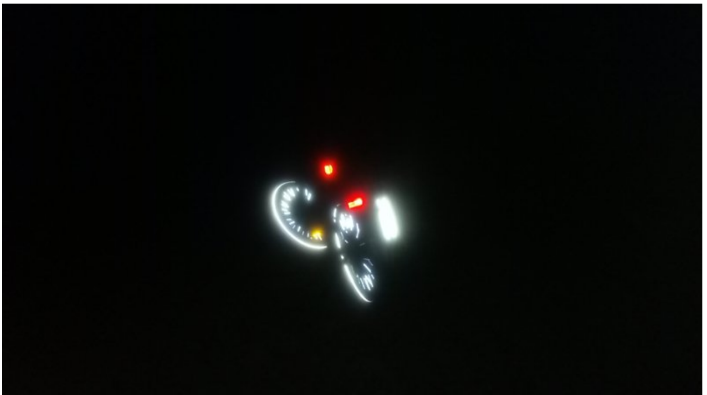
Kein Licht und keine Reflektoren (zur Simulation also kein Licht beim Fotografieren) - gut getarnt