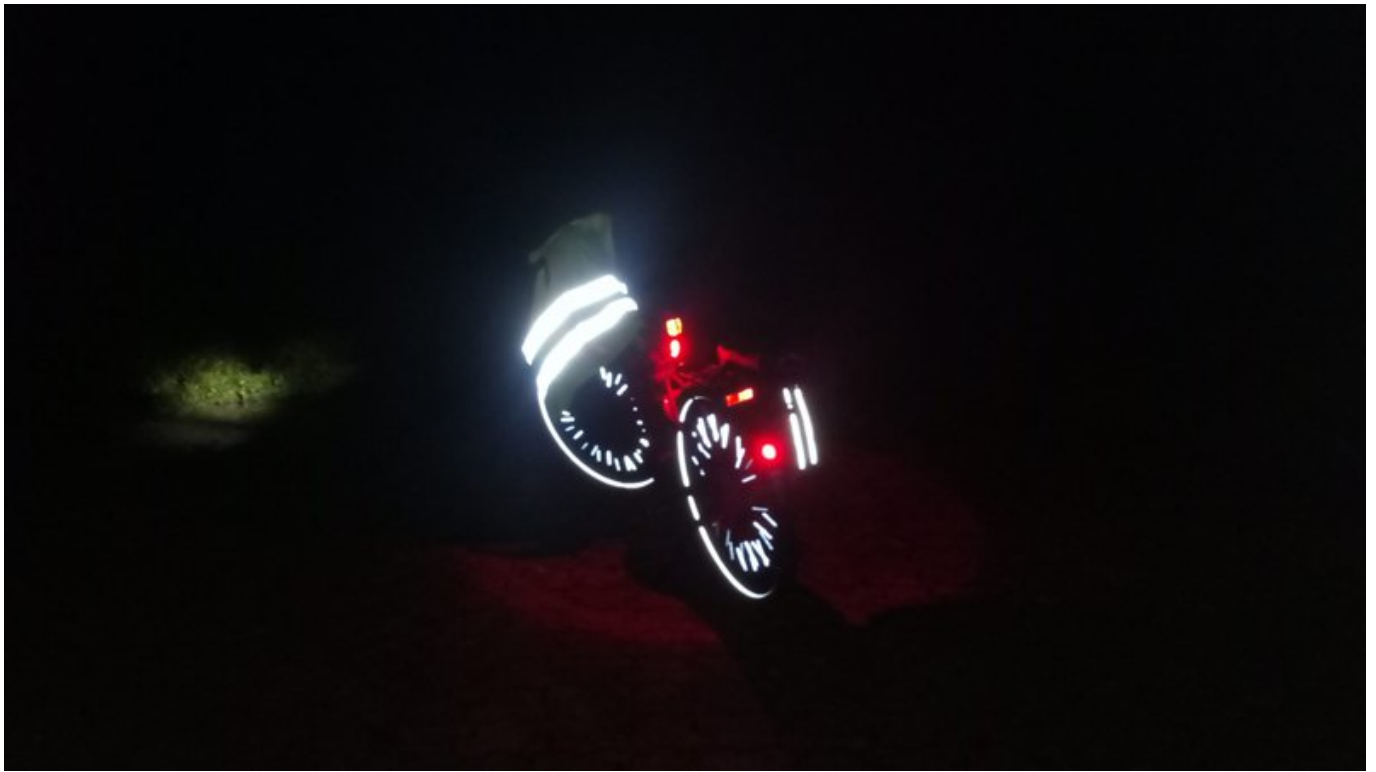
Nur Reflektoren am Rad ohne Licht / keine Warnweste - immerhin