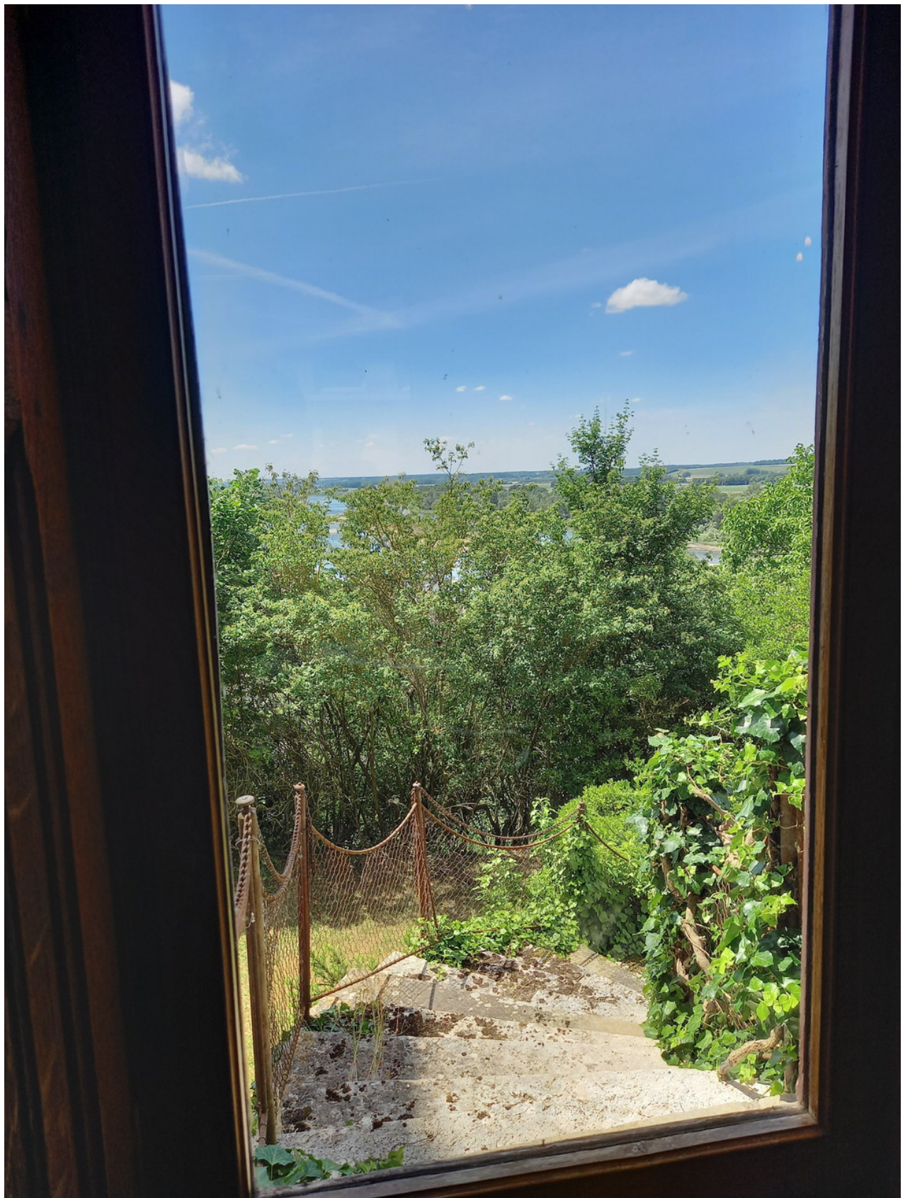
_ Blick vom Schloss aus: die Treppe runter in den Garten