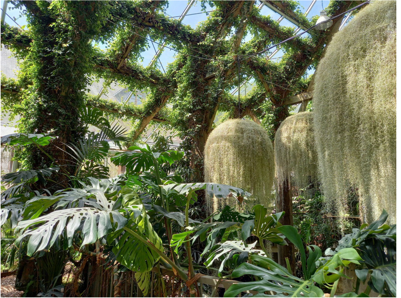
— Ab hier dann der Teil mit der Gartenausstellung des Schloss