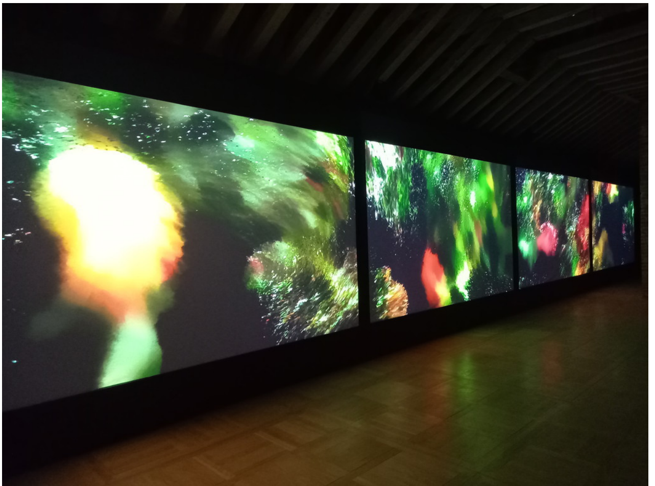
_ Diese Video Installation war noch die angenehmste Kunst: Bilder von Blumen wurden pixelweise zur nächsten Blume "gemorph"