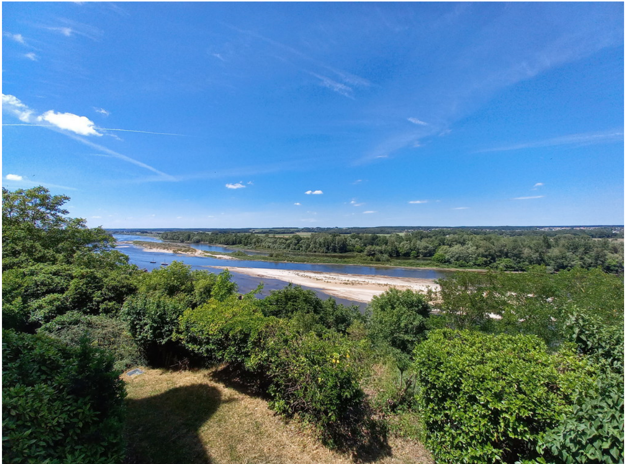
_ Der Ausblick vom Schloss auf die Loire