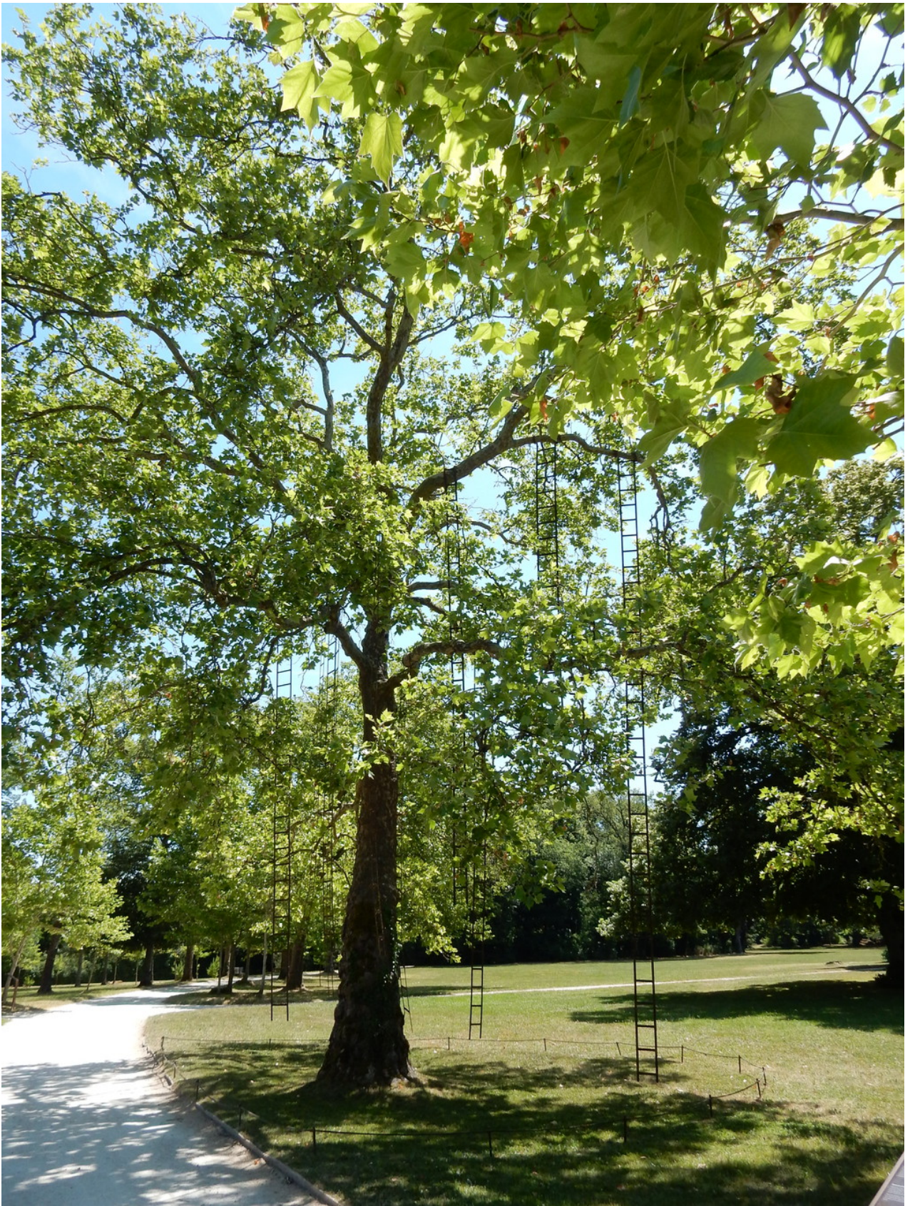
— Auch im Park "Kunst": rostige Leitern im Baum