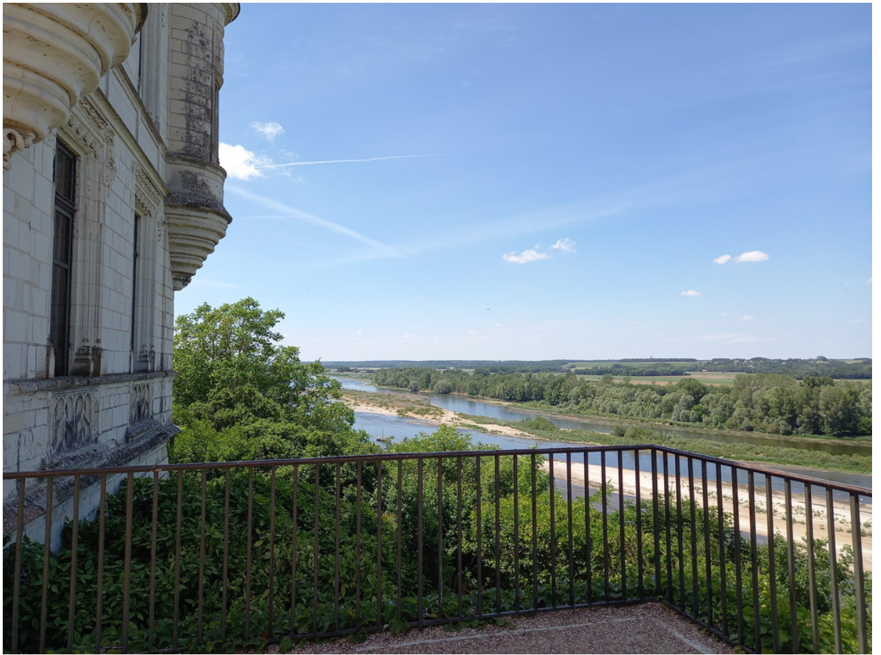
— Der Ausblick vom Schloss auf die Loire