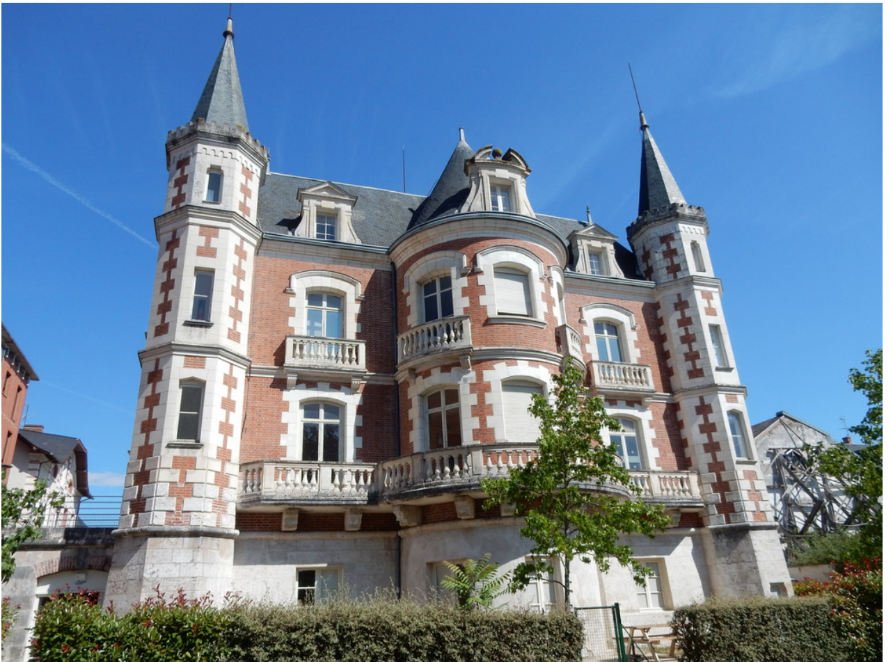
• Zurück in der Unterkunft