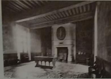
La salle du conseil. Photographie, vers 1850-1860.