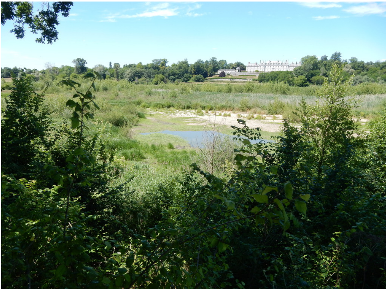
— Wieder ein schönes Beispiel für den Wassermangel in der Loire