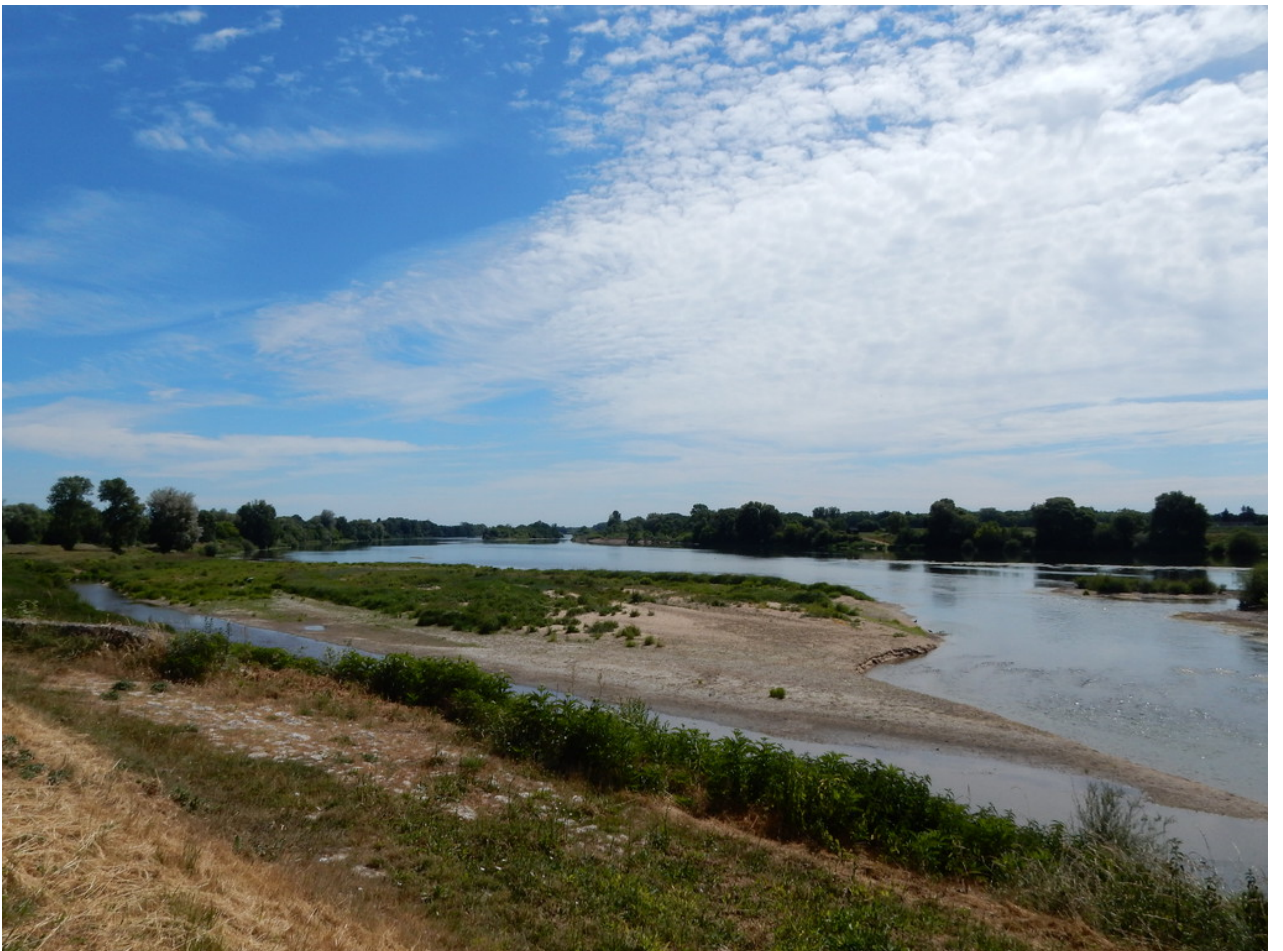
— Unglaublich, wie flach die Loire ist