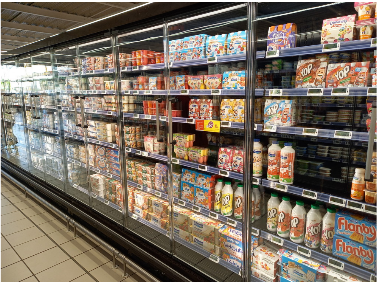
Und hier ist eine Reihe (von 4) für Milchprodukte. Ist halt auch nur ein kleiner Supermarkt ...