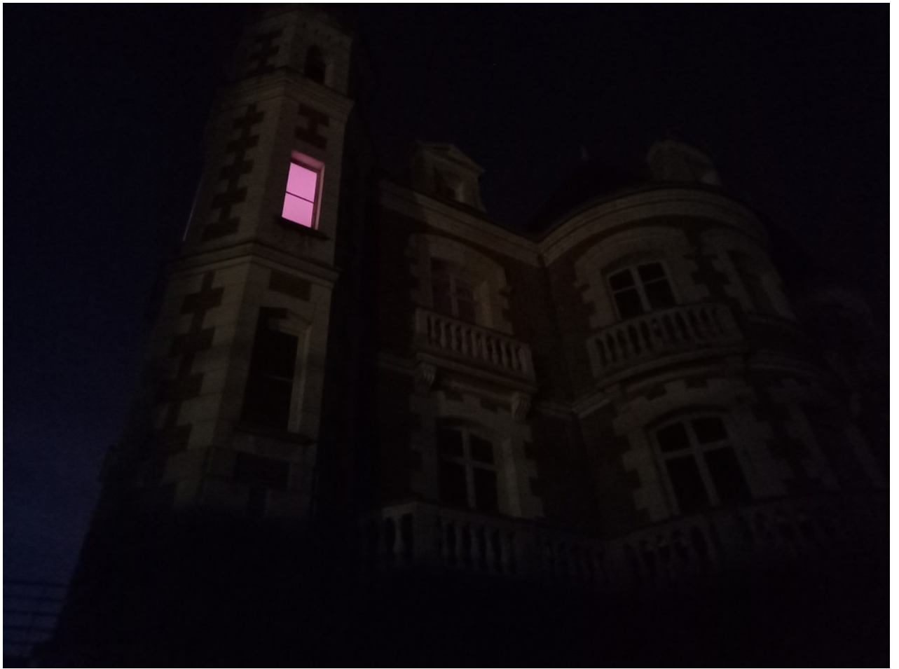
— Die Schokoladenfabrik "Poulain" bei Nacht