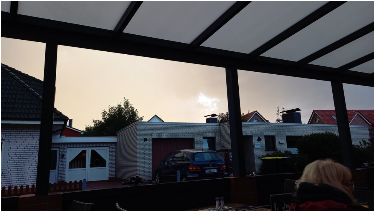
— Im Restaurant draußen sitzen schützt ggf. auch nicht vor Corona