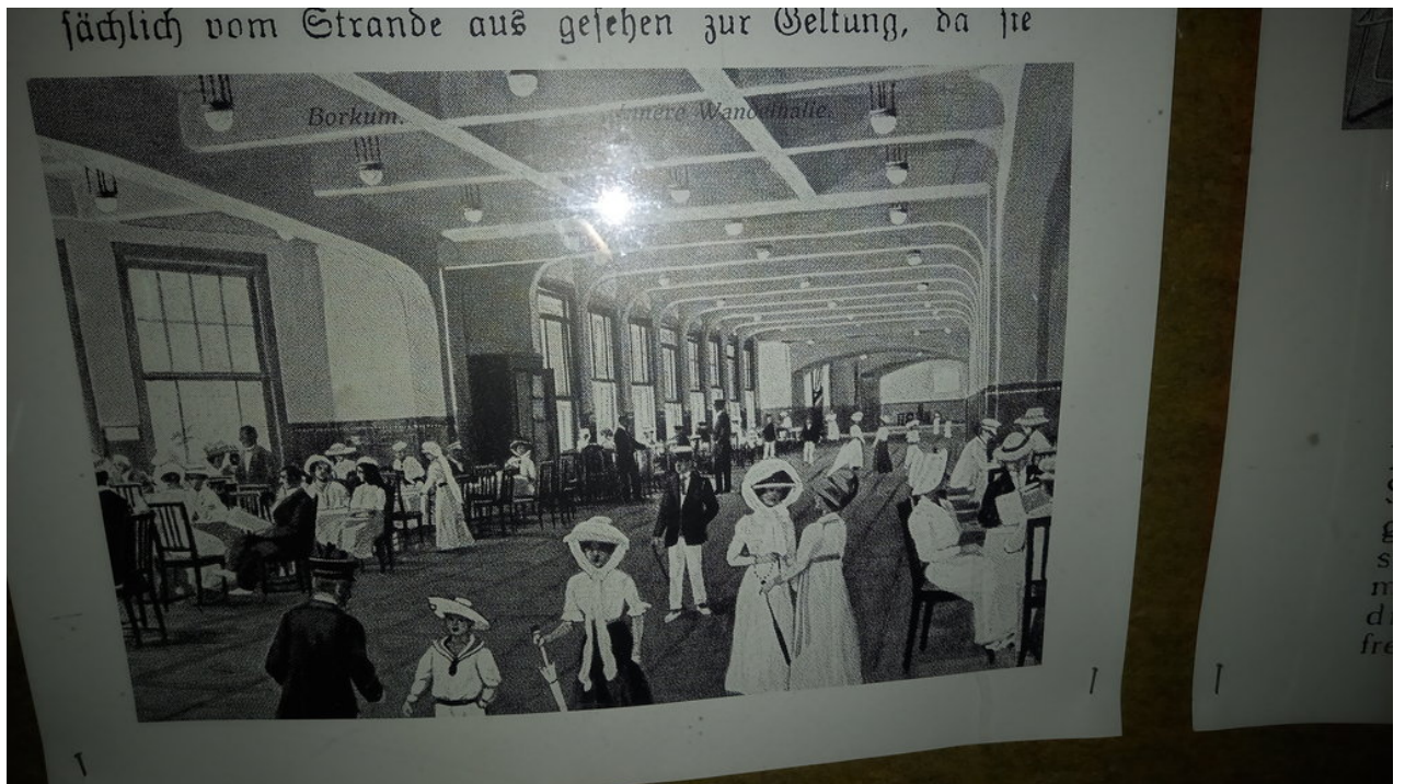
— So sah die Wandelhalle damals aus