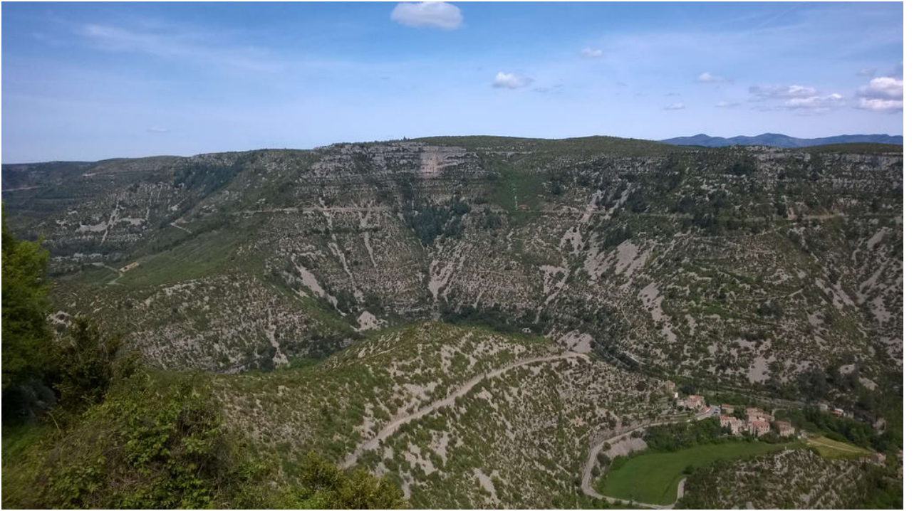
— Cirque De Navacelles