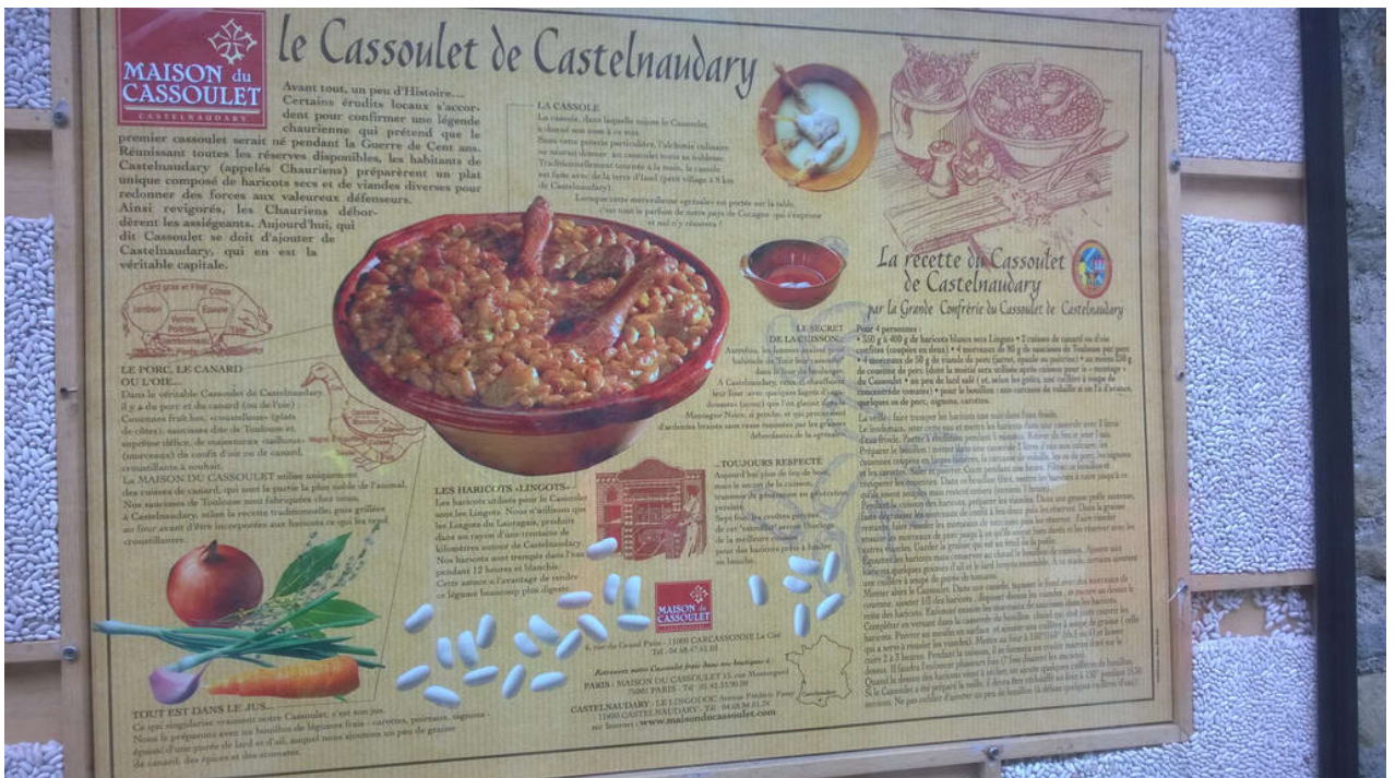
— Wieder ein Rezept zum Nachkochen.