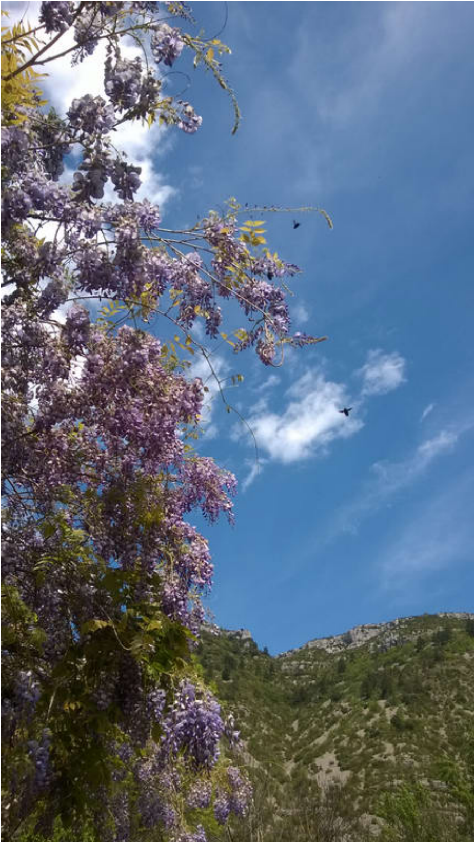
Cirque De Navacelles