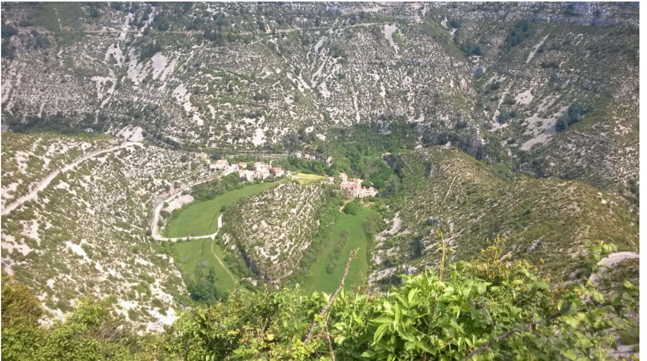
— Cirque De Navacelles