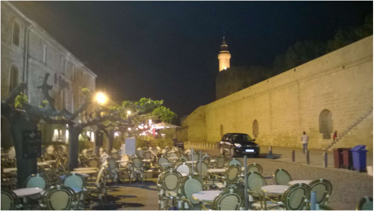
• Le Grau-du-Roi