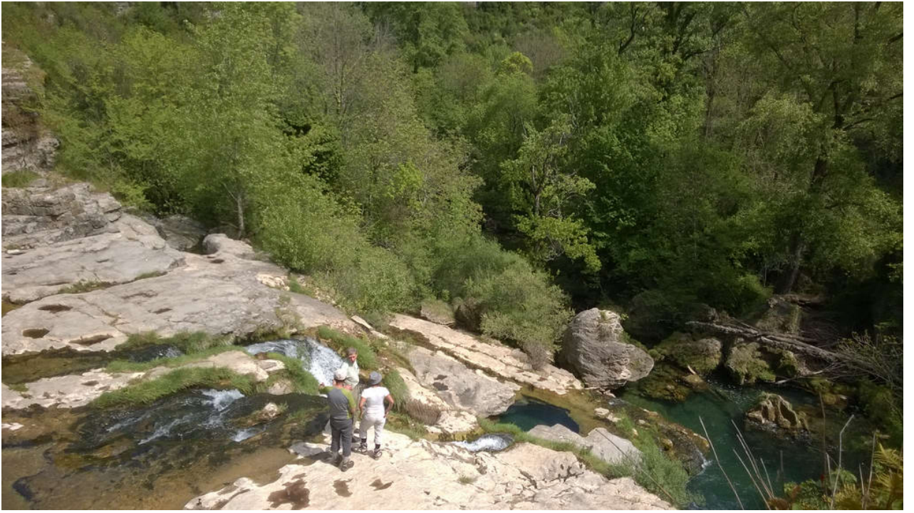
— Cirque De Navacelles