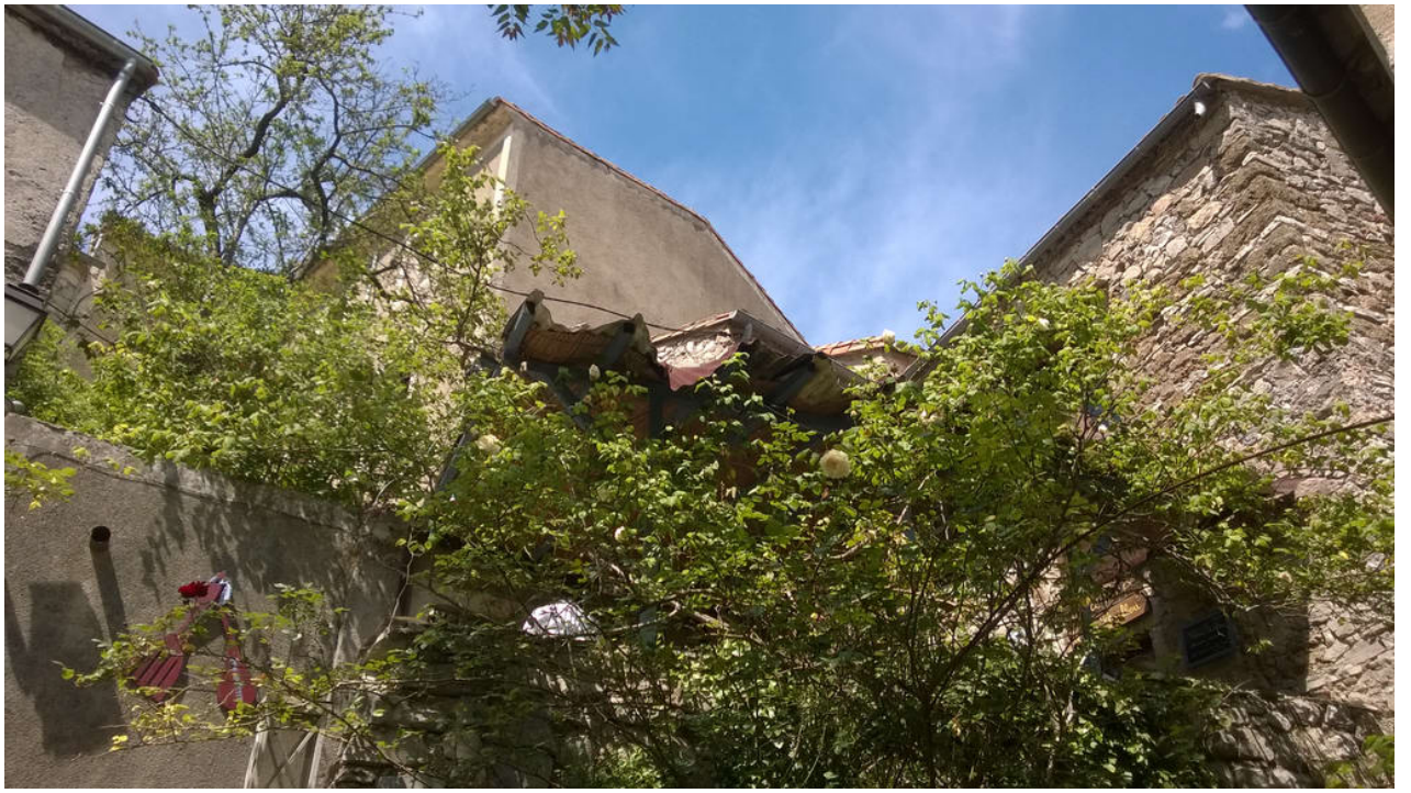
— Cirque De Navacelles