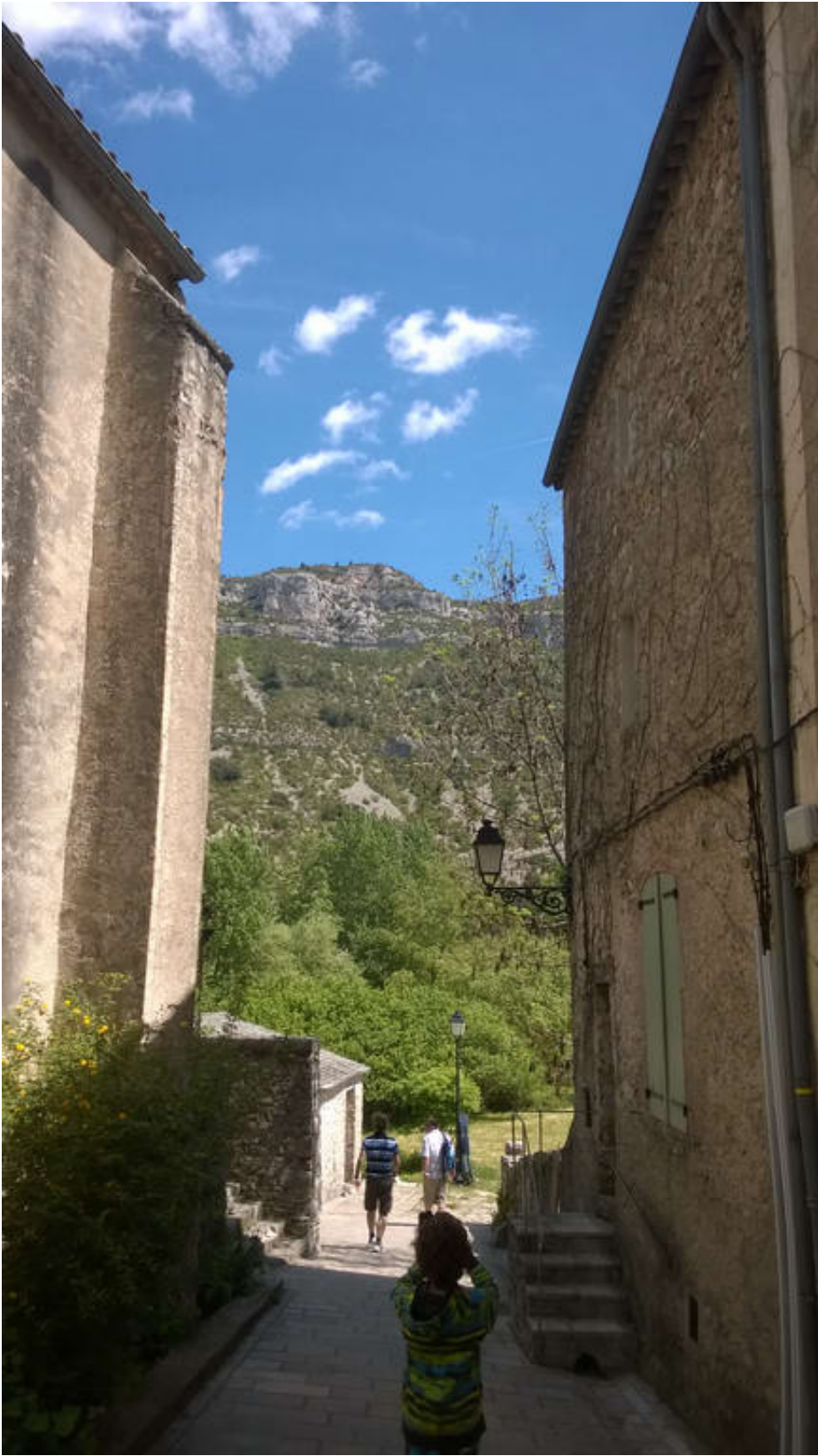
Cirque De Navacelles