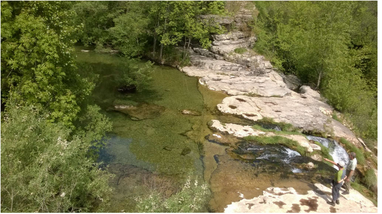
— Cirque De Navacelles