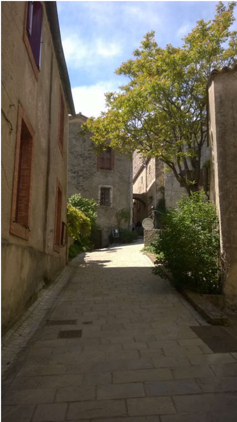
Cirque De Navacelles