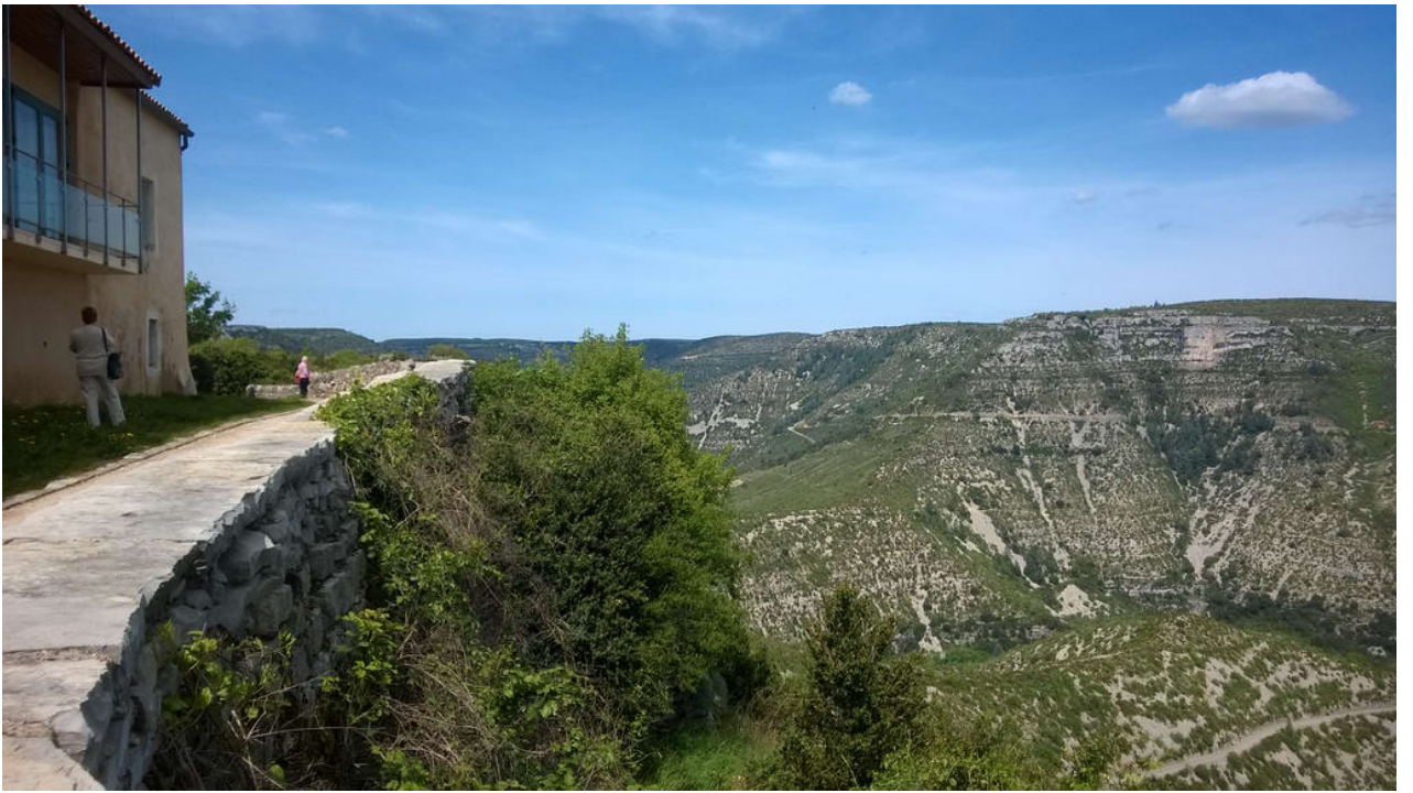
— Cirque De Navacelles