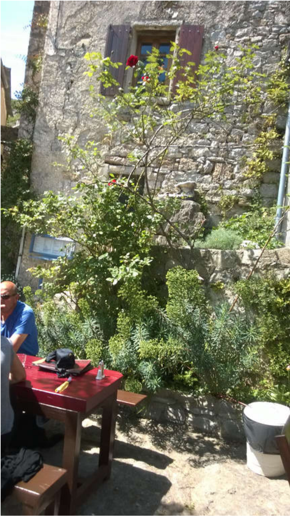
Cirque De Navacelles