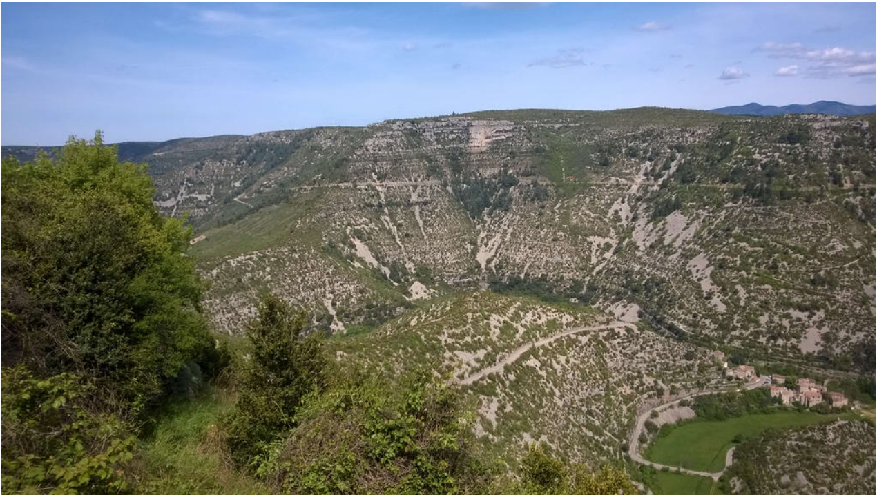
— Cirque De Navacelles