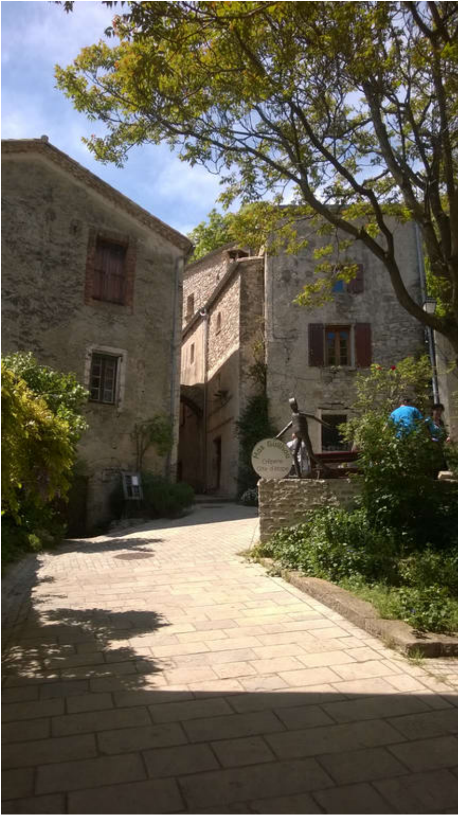
Cirque De Navacelles