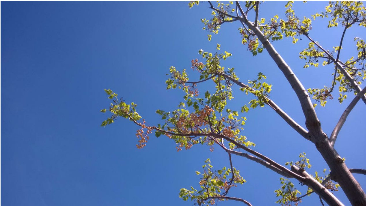
• Wo zum Henker kommen zu dieser Jahreszeit die Früchte an diesem Baum her?