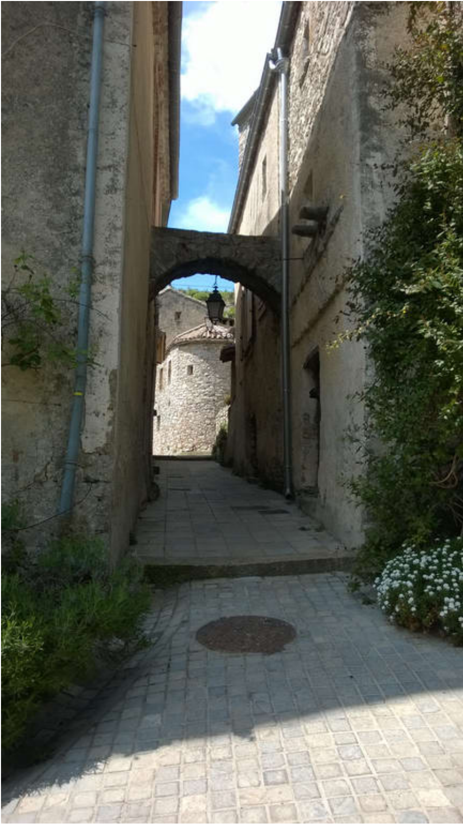
Cirque De Navacelles