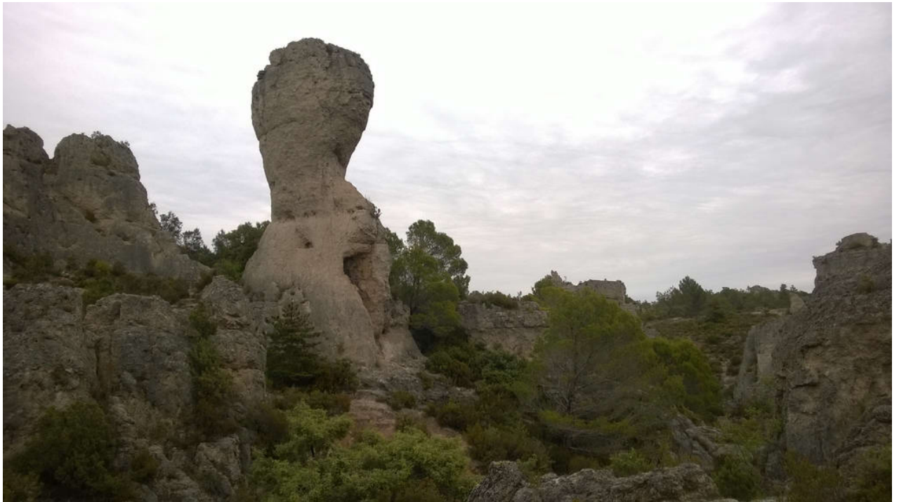
_ Le Cirque de Mourèze (Felsenmeer)