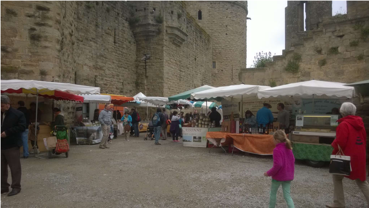
• _ Carcassonne