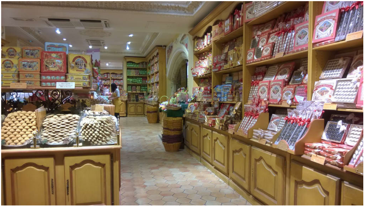
• — Pézenas