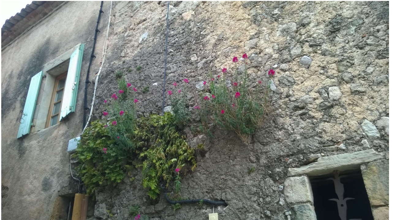
— Le Cirque de Mourèze (Felsenmeer)