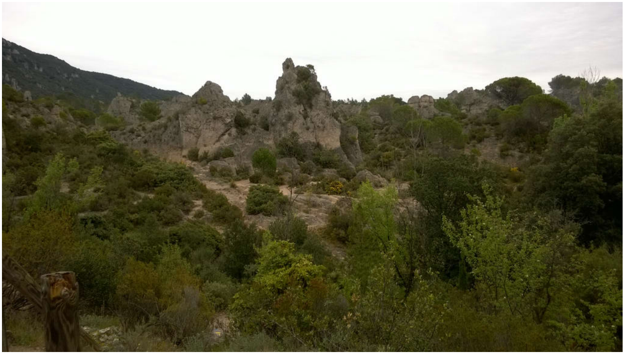
• Le Cirque de Mourèze (Felsenmeer)