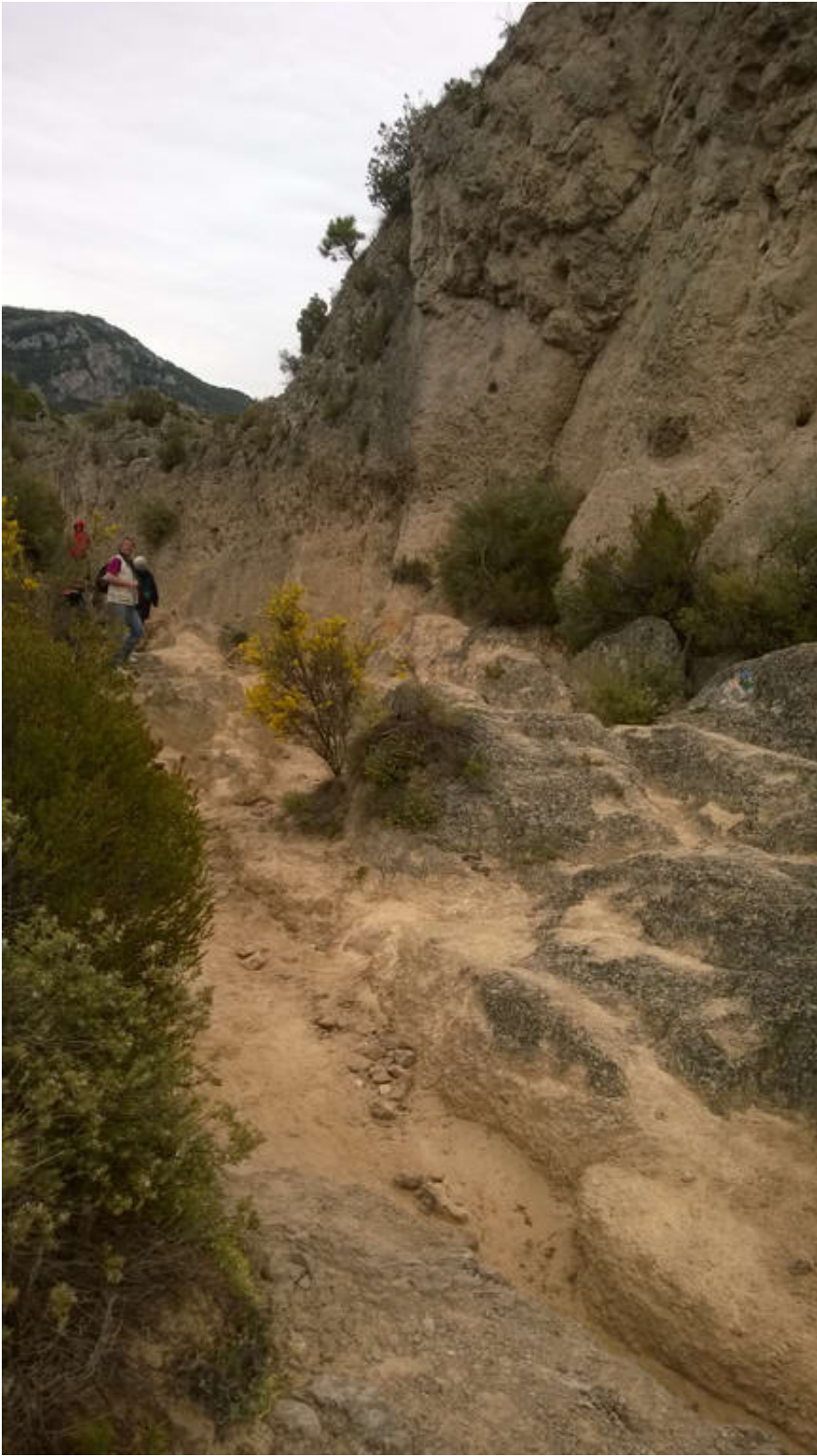
Le Cirque de Mourèze