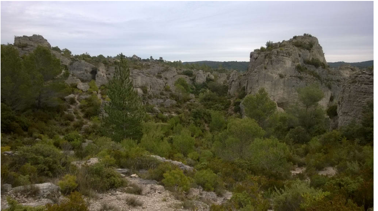
• Le Cirque de Mourèze (Felsenmeer)