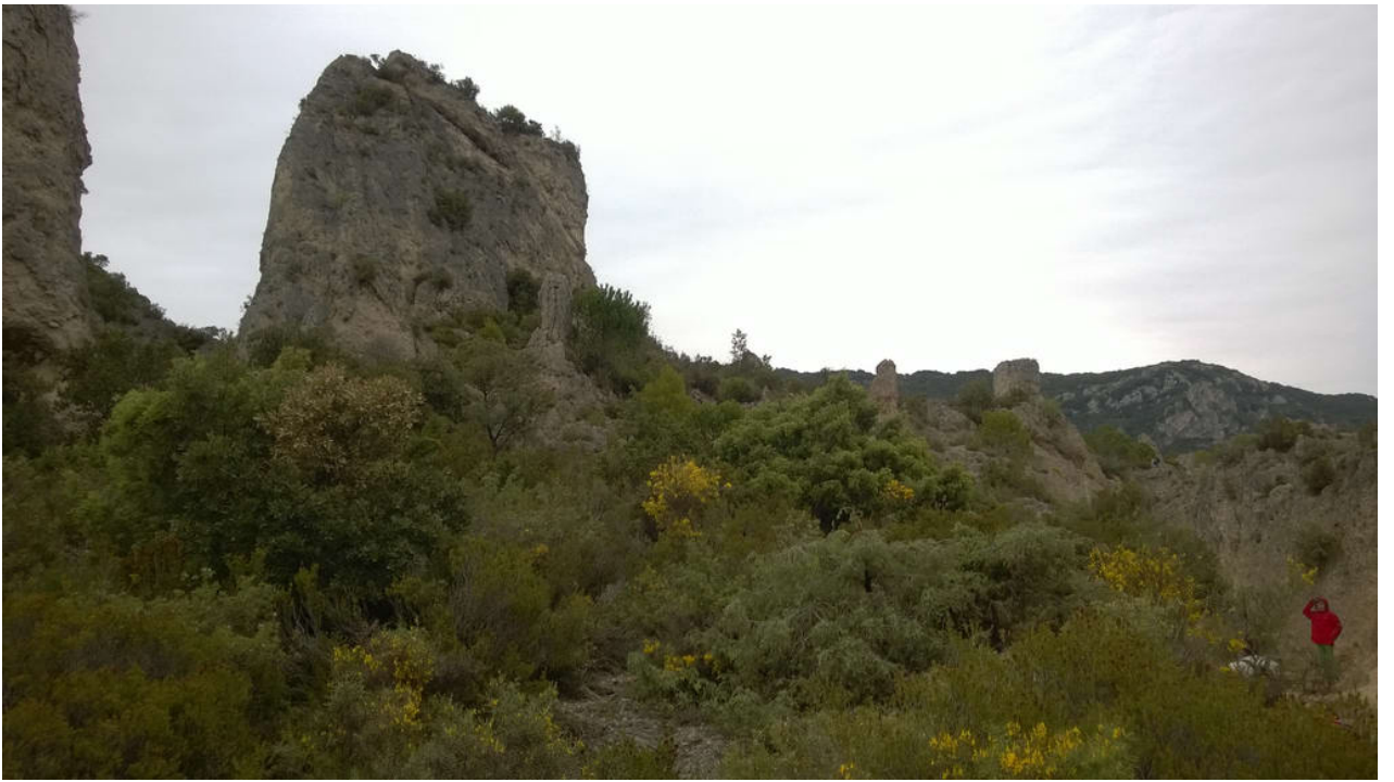
Le Cirque de Mourèze (Felsenmeer)