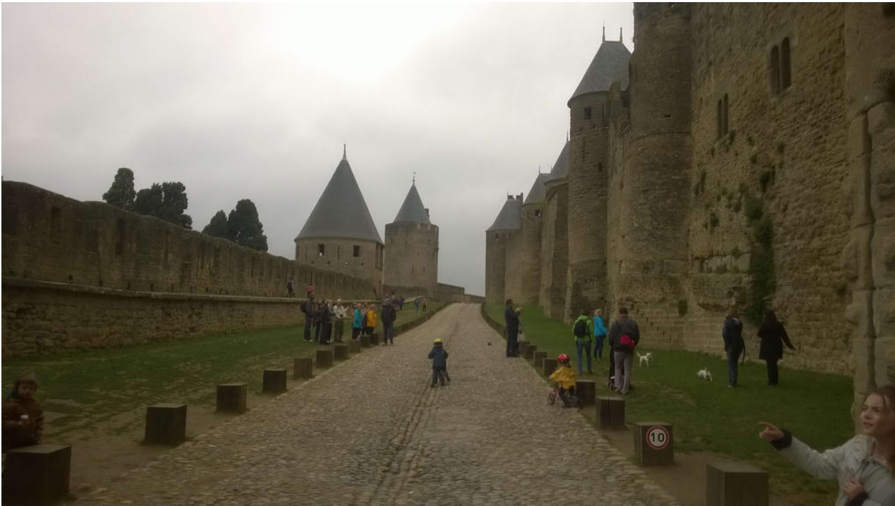
• _ Carcassonne