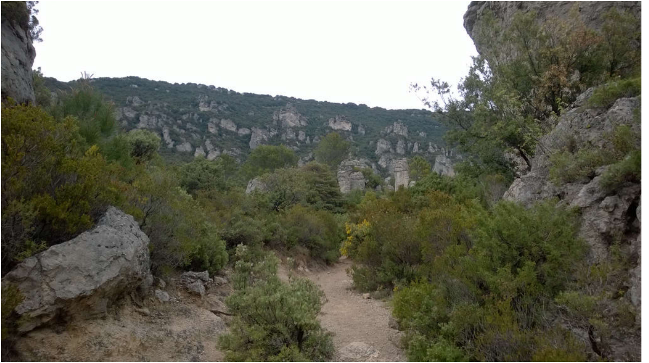
• Le Cirque de Mourèze (Felsenmeer)