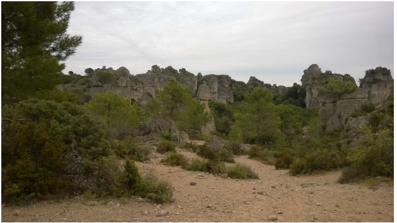
_ Le Cirque de Mourèze (Felsenmeer)