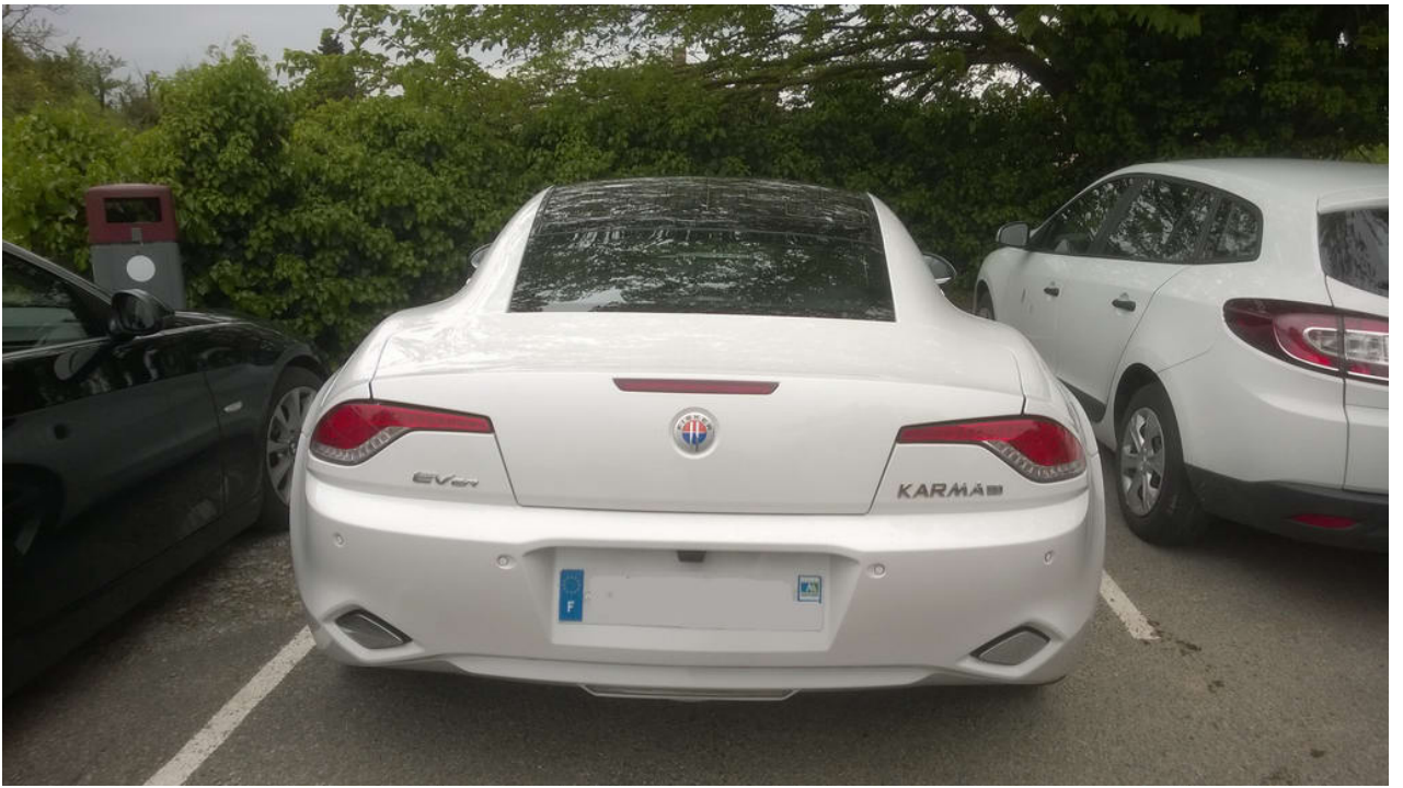
• _ Fisker Karma. Hatte ich noch nie gesehen.