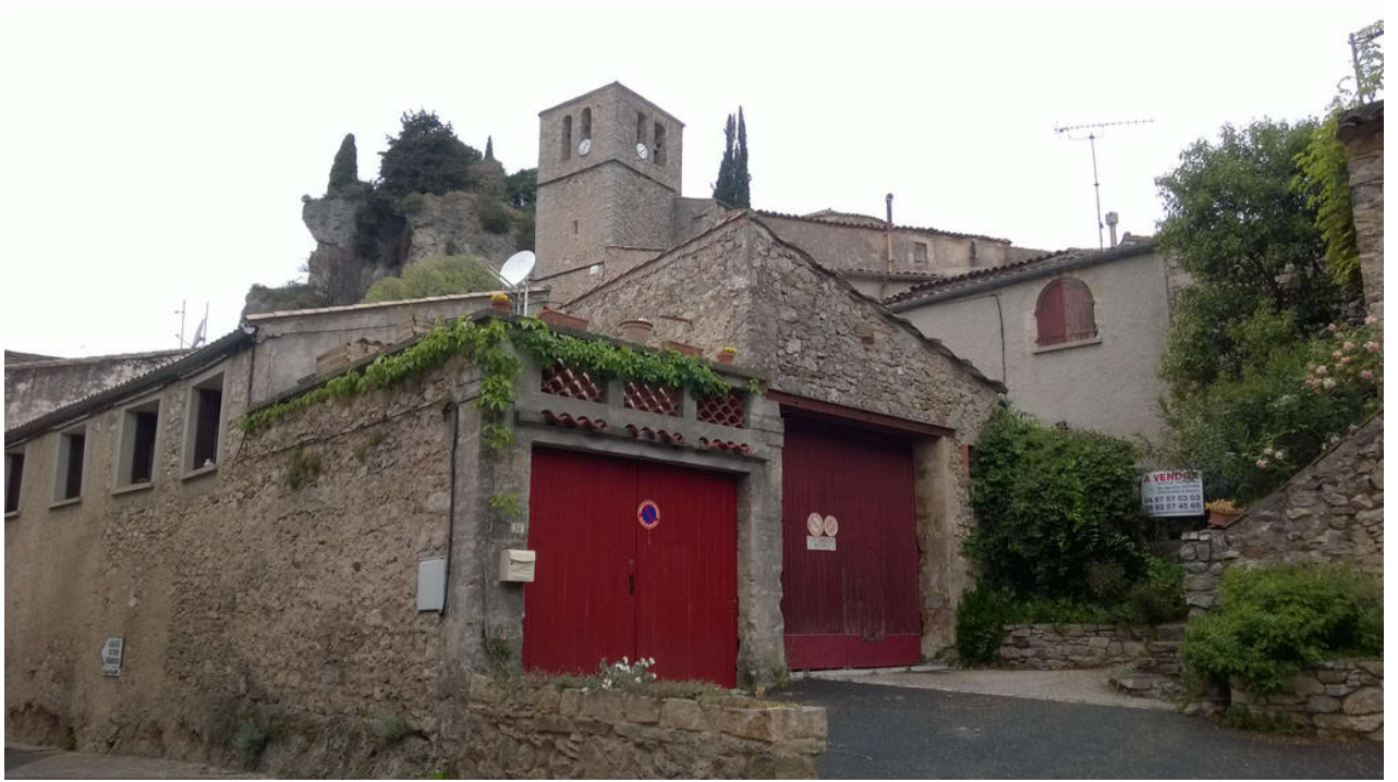
— Le Cirque de Mourèze (Felsenmeer)