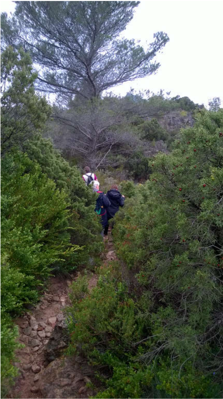
Le Cirque de Mourèze