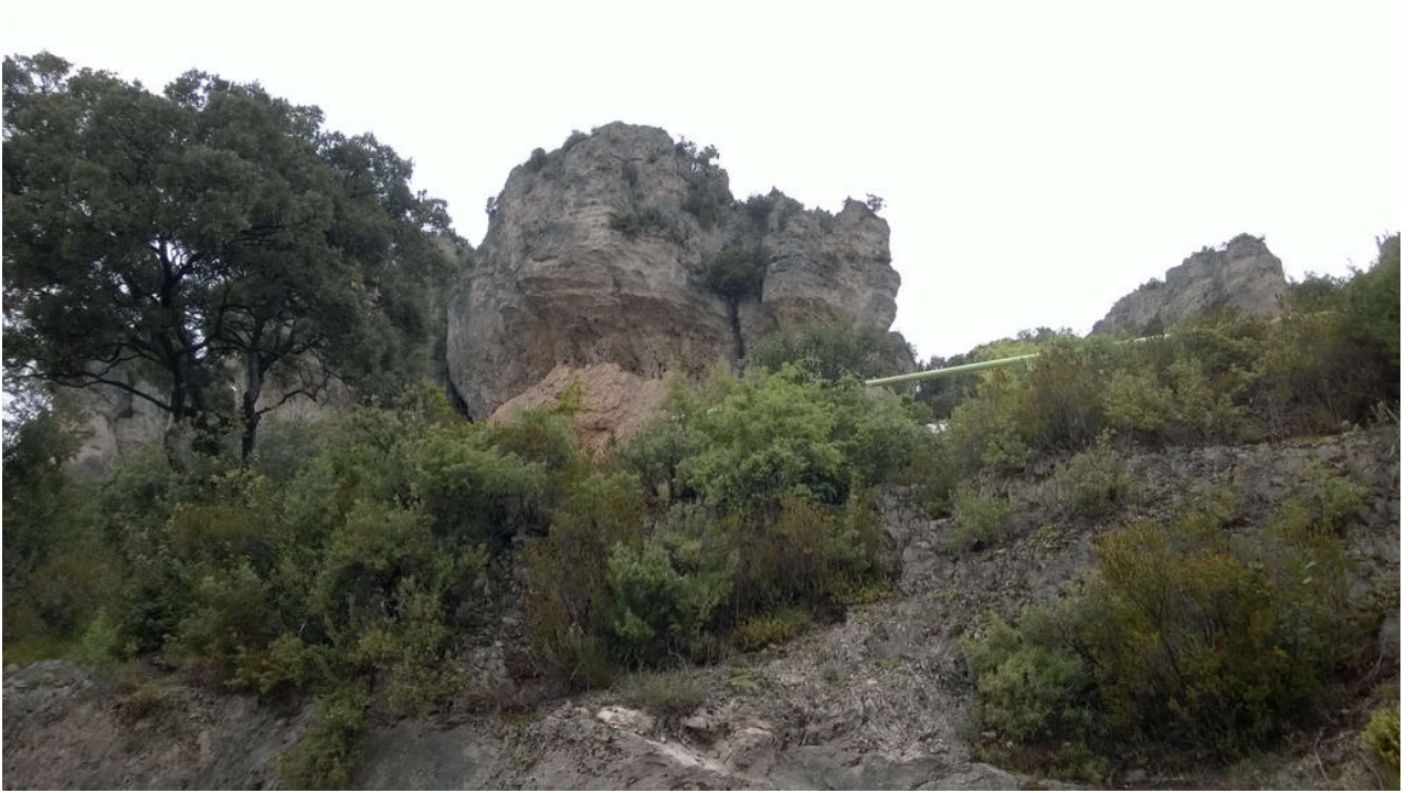
• Le Cirque de Mourèze (Felsenmeer)