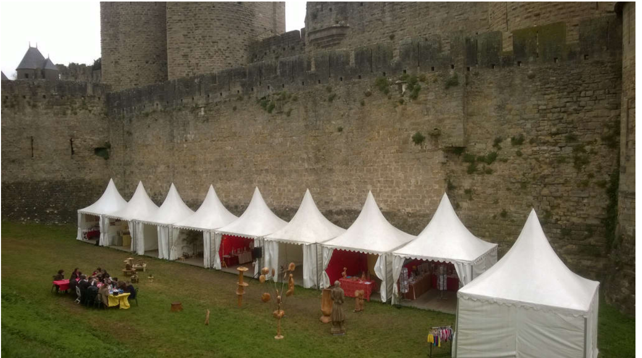
• _ Carcassonne. Als wir da waren, gab es ein Mittelalter-Wochenende.