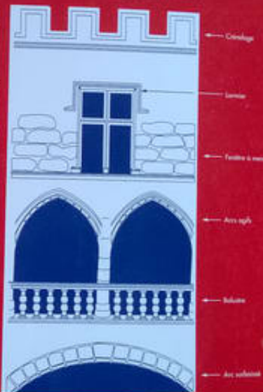
Reconstitution d'une façade en élévation

SP Hotel de Lacoste : Propiedad de los Montégut, señores de Lacoste, el hotel fue acondicionado entre 1509 y 1518 (vestibulo, patio, galeria). La escalera fue cubierta con una bóveda ojival en 1638, la fecha está inscrita en una de las claves. La fachada de entrada fue modificada en los siglos XVI y XVIII.