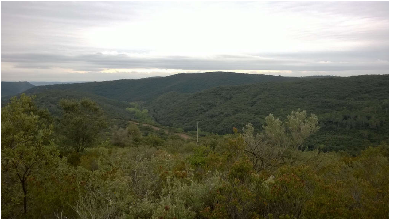
Le Cirque de Mourèze (Felsenmeer)