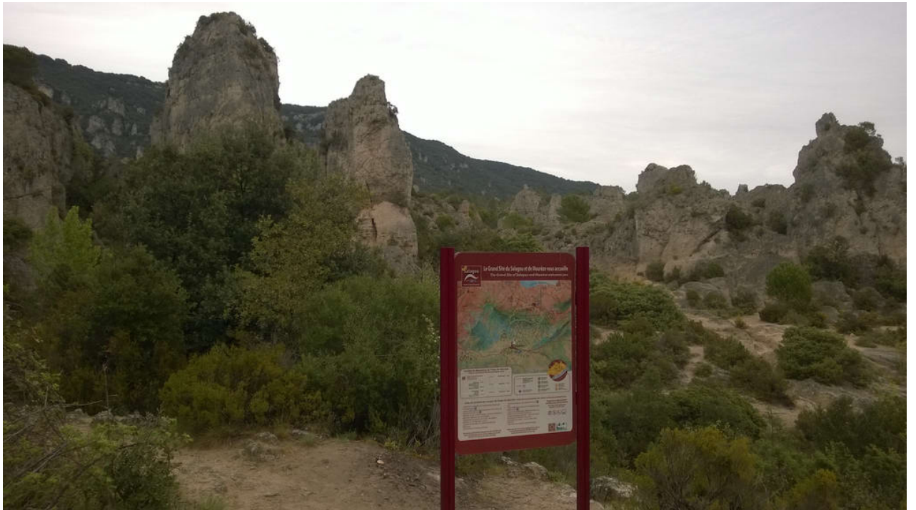
• Le Cirque de Mourèze (Felsenmeer)