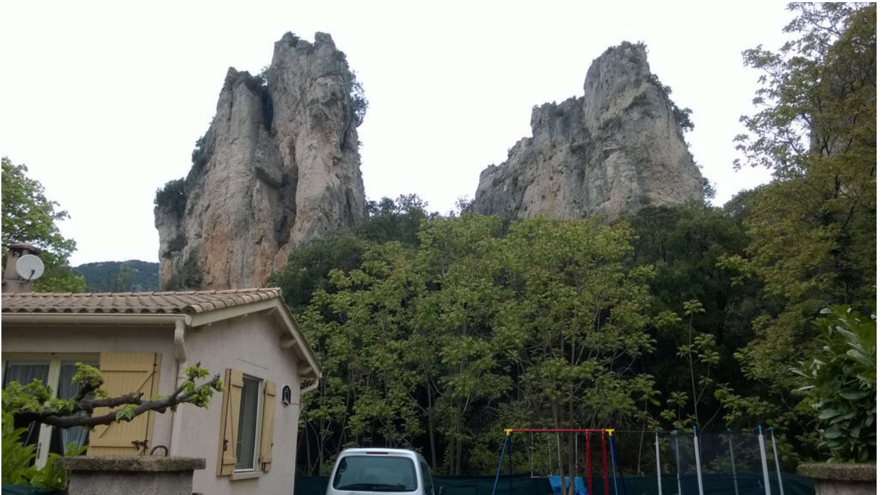
• Le Cirque de Mourèze (Felsenmeer)