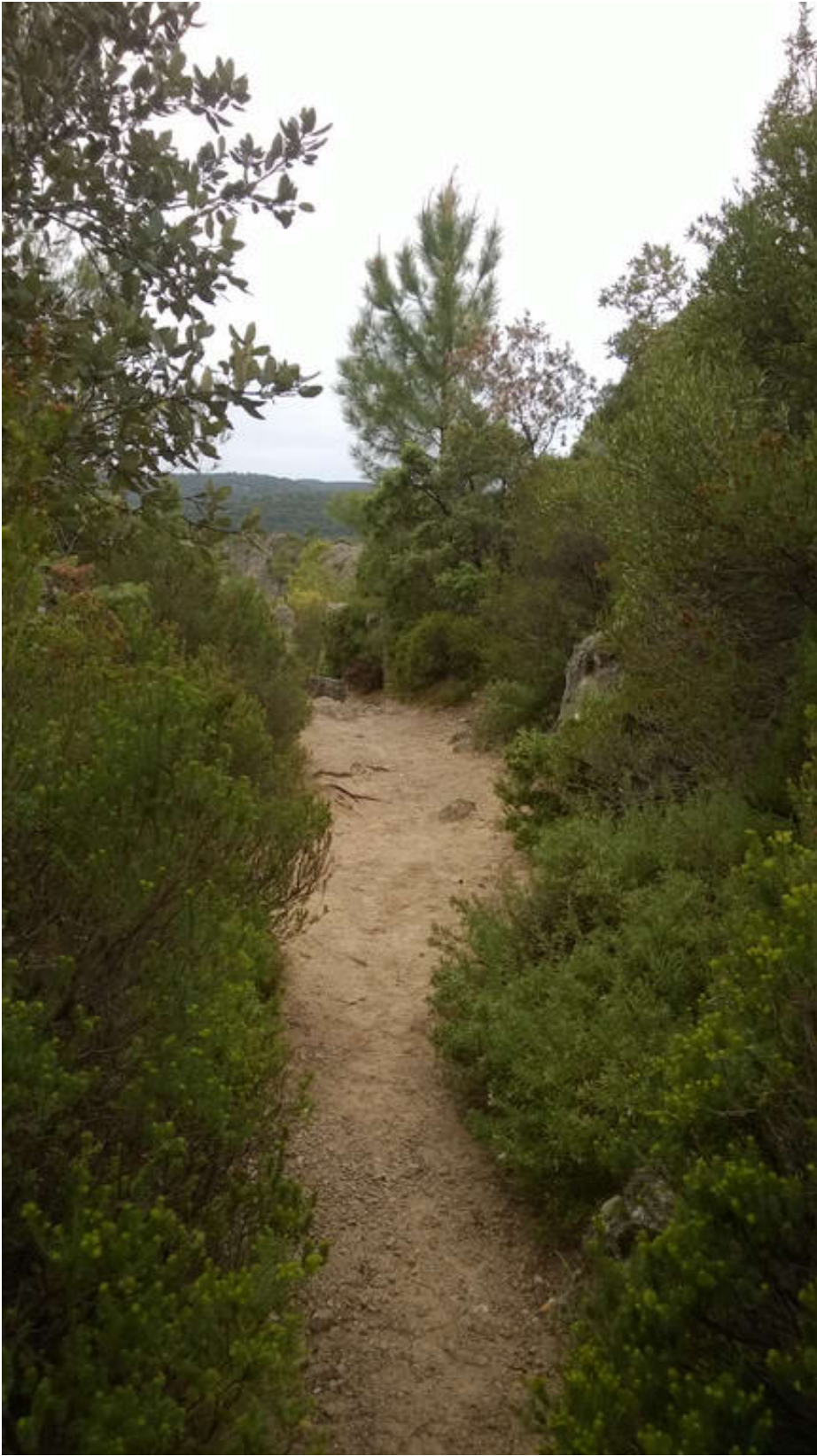
Le Cirque de Mourèze