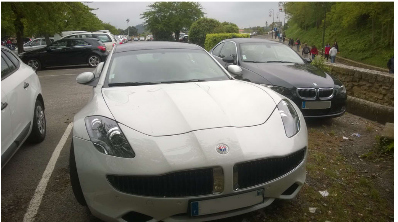
• — Fisker Karma. Hatte ich noch nie gesehen.